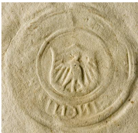
Fot 1: Odcisk pieczęci opłatkowej Kcyni, z dokumentu z 1576 r. 19

Kcynia została lokowana w 1262 roku, ale pierwszy zabytek sfragistyczny jest przynajmniej jeden albo nawet dwa wieki 17 młodszy. Pieczęć ta znana jest w wersji opłatkowej, istnieje także jej odcisk w laku luzem (bardzo zniszczony) oraz odrys autorstwa Wiktora Wittyga. Pieczęć okrągła, o średnicy 28 mm, przyłożona była na dokumencie z 1576 roku. W polu pieczęci tarcza wycięta w dwa półkola u góry, w której orzeł, chyba bez korony. Szyja lekko wygięta, wydatne uda, lotki w skrzydłach w dół i lekki ukos, dłuższe u dołu i coraz krótsze ku górze. Legenda praktycznie niewidoczna, widać jedynie CINEN (zapewne SIGILLUM KCINENSIS ) 18 . Zwraca uwagę fakt, że legenda jest w odbiciu lustrzanym przy jednoczesnym zwrocie głowy orła w prawo. Należałoby się więc zastanowić, czy na właściwym herbie, głowa nie powinna być zwrócona w lewo.