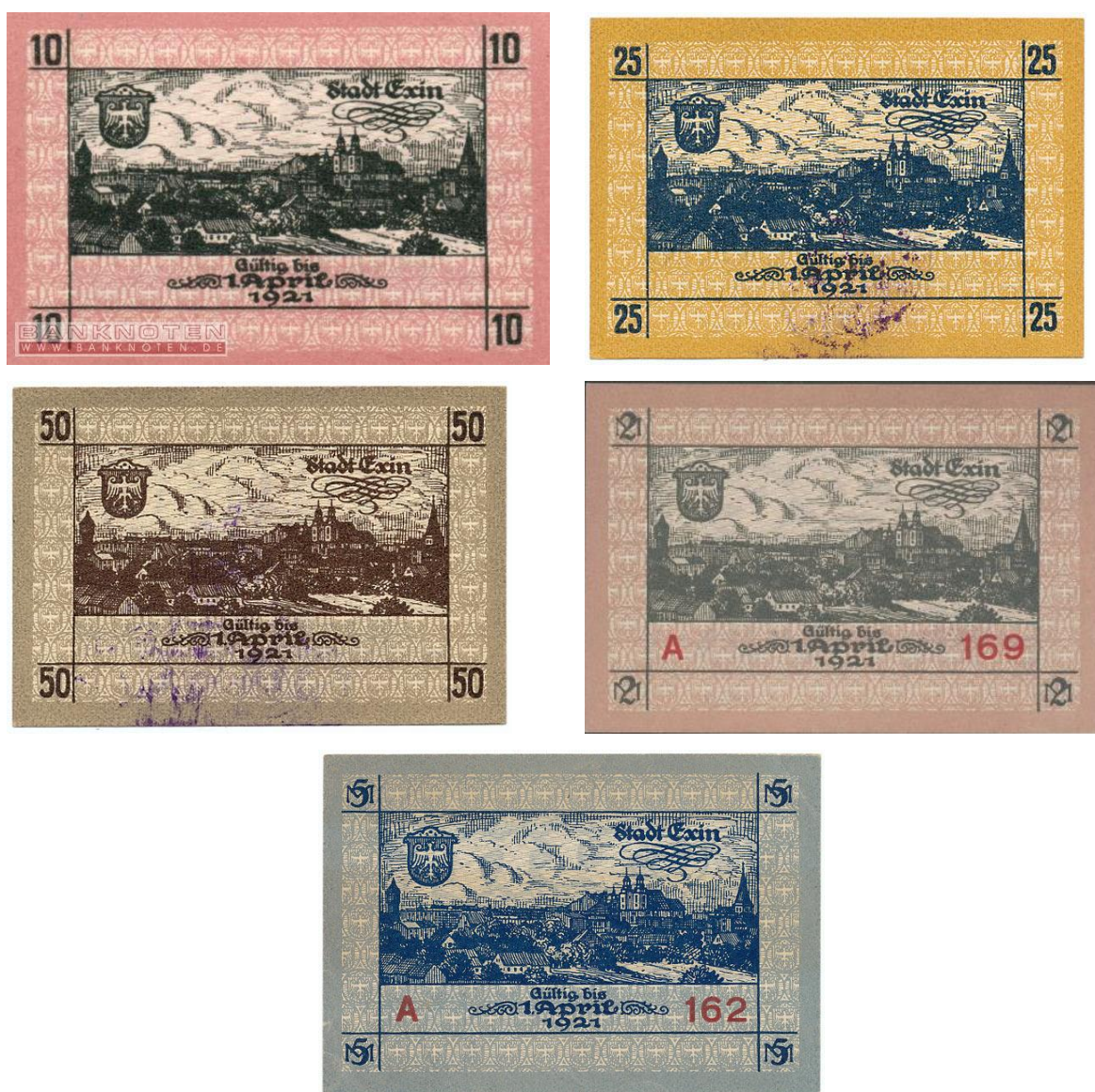
Fot 11: Pięciomarkowy notgeld Kcyni 32

W Kcyni, w ostatnich latach I wojny, w obiegu były także banknoty zastępcze, tzw. notgeldy . Nominaty to m.in. 10, 25 i 50 pfenigów oraz 1, 2 i 5 marek. Banknoty te na odwrotnej stronie miały widoczek miasta oraz herb według kompozycji Vossberga.