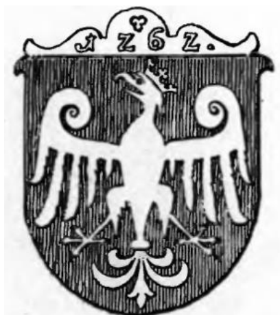
Fot 6: Herb Kcyni w/g Vossberga, za XIX-wieczną pieczęcią 27

Następna znana pieczęć miejska Kcyni, pochodząca z końca XIX wieku, o legendzie MAGISTRAT UND POLIZEIVERWALTUNG IN EXIN , wprowadza już pruskie symbole państwowe. Herb Kcyni nie został jednak zapomniany. Przytacza go np. O. Hupp. Mimo średniowiecznej proveniencji miasta, Hupp proponuje dla kcyńskiego orła stylistykę bliższą XVII-wiecznej pieczęci. Barwę złotą ma już nie tylko korona, ale także oręż orła.