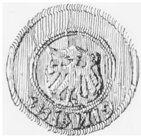
Fot 2: Odrys tej samej pieczęci, autorstwa W. Wittyga 20