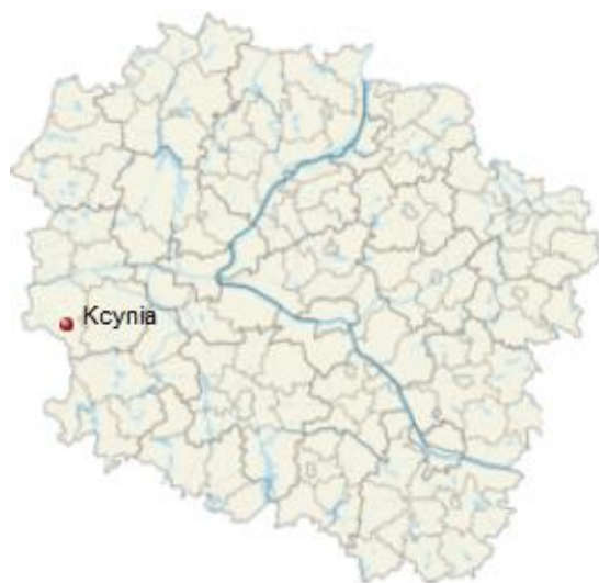
Rysunek 2: Położenie Kcyni na mapie województwa 13

Kcynia to miasto w województwie kujawsko-pomorskim, w powiecie nakielskim, siedziba miejsko-wiejskiej gminy Kcynia. Leży w regionie historyczno-geograficznym zwanym Pałukami i jest uznawana za jedną z jego historycznych stolic. Obecnie stanowi ośrodek rolniczo-usługowy na Pojezierzu Gnieźnieńskim, na pld.-zach. od Bydgoszczy 14 .