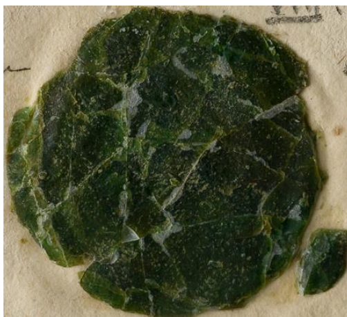
Fot 3: Pieczęć opłatkowa Kcyni, znana z powyższego odcisku 21