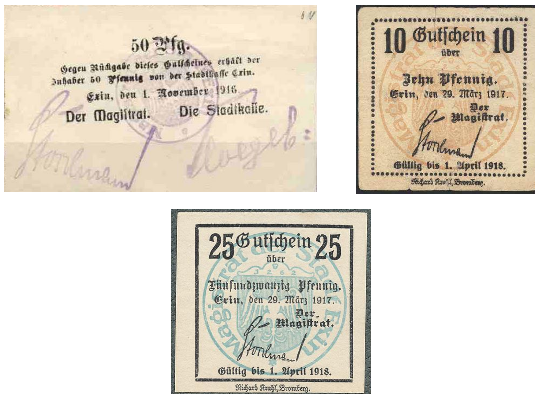
Fot 9: Różne przykłady kuponów i bonów miejskich Kcyni z lat I wojny światowej, z widocznymi odciskami pieczęci miejskiej z legendą niemiecką oraz polskim godłem 30

zarówno właściwych Niemiec jak i na ziemiach zaboru pruskiego. Na kuponach uprawniających do wypłacenia z miejskiej kasy różnych nominałów, wydawanych m.in. w latach 1914, 1916, 1917 można dostrzec odciski w tuszu pieczęci z legendą MAGISTRAT DER STADT EXIN i z kompozycją znaną m.in. z Vossberga w polu pieczęci. Jest to zatem niezwykle przykładowa pieczęć miejskiej Kcyni, gdzie przy niemieckiej legendzie mamy polski herb w polu tarczy.