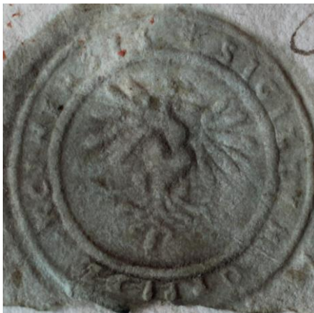
Fot 4: Odcisk pieczęci Kcyni z 1636 roku 23

Kolejna pieczęć przyłożona jest na dokumencie z 1636 roku, prawdopodobnie wykonano ją w XVII wieku. Pieczęć okrągła, o średnicy 30 mm. W polu pieczęci, bez tarczy, orzeł wyraźnie zwrócony w lewo. Nadal ciężko odróżnić ewentualną koronę. Orzeł jest z wyraźną wydatną piersią i rozbudowanym ogonem. Skrzydła rozwinięte w wachlarz. Legenda otokowa głosi SIGILLUM OPPIDI KCINENSIS 22 .