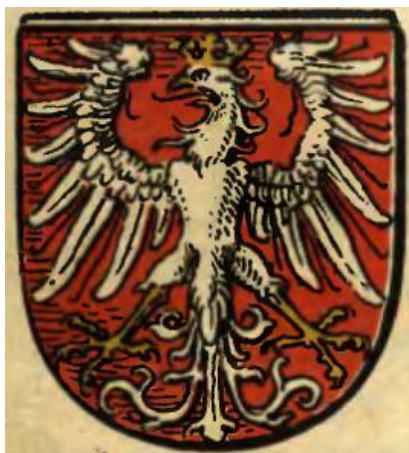
Fot 19: Herb Kcyni według O. Huppa 44

Ostatnią, najważniejszą kwestią, dotyczy stylizacji orła. Wiosną 2013 roku zaproponowaliśmy stylizację, którą próbowaliśmy wywieść z mało czytelnego rysunku orła na najstarszej znanej pieczęci Kcyni. Niestety, w rezultacie uzyskaliśmy rysunek, który w listopadzie 2013 negatywnie zaopiniowała Komisja Heraldyczna przy MAiC, wskazując, że proponowany orzeł jest „eklektyczny”, tzn. łączy elementy stylów plastycznego kształtowania orła z różnych epok. W związku z tym postanowiliśmy odejść od prób interpretowania najstarszej pieczęci Kcyni i stworzyć własny rysunek, uwzględniający stylistykę jednej konkretnej epoki. Wykorzystanie pieczęci i innych historycznych przedstawień herbu Kcyni ograniczamy zatem wyłącznie do ich treści merytorycznej, tj., że godłem kcyńskiego herbu powinien być srebrny orzeł w koronie. Po dwóch konsultacjach z Komisją Heraldyczną przy MAiC doszliśmy do konsensusu, w ramach którego została przyjęta stylizacja nawiązująca do przedstawień autorstwa Ottona Huppa, korzystnych kompozycyjnie i artystycznie.