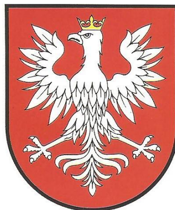
Fot 16: Herb Kcyni według Plewako i Wanaga 37

W latach 90 XX wieku nastąpił gwałtowny i niekontrolowany renesans zainteresowania heraldyką samorządową. Było to po części zapewne spowodowane zmianami w ustawodawstwie, które umożliwiło miastom i gminom przyjmowanie herbów. Niestety często dochodziło wówczas do sytuacji, gdy wizerunki herbów tworzone bez dogłębnego badania historycznego, zaś procedurę powierzano osobom nieobeznany z sztuką heraldyczną. Kcynia nie była tutaj wyjątkiem. Na potrzeby symboliki miejskiej opracowano herb odwołujący się do rekonstrukcji Vossberga, nie sięgając do źródeł starszych. W części oficjalnych źródeł, takich jak np. BIP miasta i gminy, herb był wręcz identyczny z tym znanym z XX-wiecznych kuponów i notgeldów – z „nagłówkiem” zawierającym datę lokacji włącznie. Herb w takiej wersji (minus „nagłówek”) pojawił się w Leksykonie miast polskich z 1998.