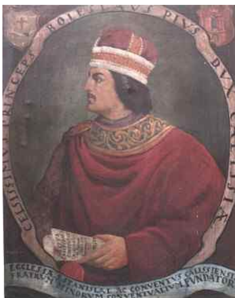
Rysunek 3: Portret Bolesława Pobożnego (XX wiek) 15