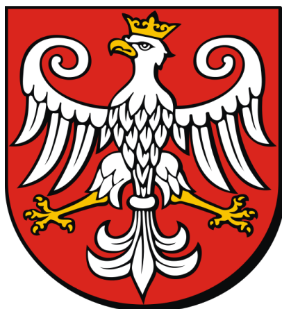
Rysunek 4: Aktualnie używany herb Gminy Kcynia 43

U progu XXI wieku, mając świadomość uchybień w używanej symbolice, władze miasta postanowiły opracować nowy wzór herbu, a także flagę. Zadanie postanowiono wykonać własnymi siłami i środkami. Niestety, również w tym wypadku, opracowany wzór nie sięgał głębiej w tradycję heraldyczną Kcyni, a jedynie był próbą przetworzenia już używanego wizerunku na styl przypominający styl Haisiga. Mimo to, herb ten uzyskał pozytywną opinię tzw. Punktu Konsultacyjnego przy MSWiA dnia 15 lutego 2000. Odmienne na ten temat wypowiedziała się nowo powołana Komisja Heraldyczna. W opinii z 20 czerwca 2000 zwrócono uwagę, że proponowany orzeł ma górną linię skrzydeł wyciętą w sposób irracjonalny i obcy dla polskiej tradycji historycznej. Wytknięto również, że wizerunek jest kompilacją elementów różnych orłów autorstwa Mariana Haisiga. Błędna zdaniem Komisji była także zróżnicowana grubość linii konturowej tarczy 40 . Mimo tego, w związku z niejasną wykładnią niektórych przepisów dotyczących Komisji Heraldycznej, wizerunek herbu Kcyni przyjęto w 2001 roku, a następnie powielano w kolejnych statutach, ostatnio w roku 2008 41 . Komisja Heraldyczna podtrzymuje swoją opinię w sprawie herbu, czego wyrazem była negatywna opinia w sprawie projektów łańcuchów władzy, powodowana głównie użyciem błędnego wzoru herbu 42 .