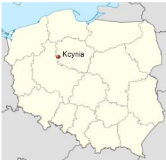
Rysunek 1: Położenie Kcyni na mapie Polski 12