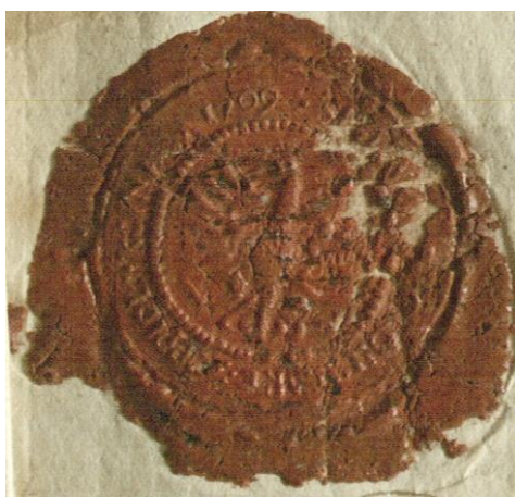
Fot 5: Odcisk w laku pieczęci Kcyni z 1709 roku 25

Zachowała się jeszcze jedna pieczęć Kcyni, datowana na 1709 rok. Pieczęć okrągła, o średnicy 30 mm. W polu pieczęci barokowy orzeł w koronie, tym razem zwrócony w prawo. Legenda otokowa, oddzielona linią perełkową, głosi SIGILLUM PROCONSULARE OPPIDI KCINA A(NNO) 1709 24 .