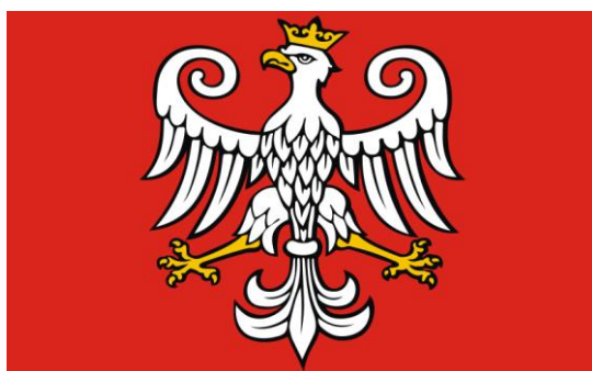
Rysunek 5: Aktualnie używana flaga Gminy Kcynia 47

Kcynia czyniła już wcześniej starania o przyjęcie flagi. Flaga przesłana do opiniowania w Komisji Heraldycznej miała być prostą flagą heraldyczną. Niestety została odrzucona. Oprócz zakwestionowanego rysunku orła, wątpliwości wzbudził sam układ flagi, ponieważ jednobarwna, czerwona flaga ze srebrnym orłem za bardzo przypominałaby dawne polskie, państwowe chorągwie wojskowe 45 . Mimo tego, w związku z niejasną wykładnią niektórych przepisów dotyczących Komisji Heraldycznej, wizerunek flagi Gminy Kcynia przyjęto w 2001 roku, a następnie powielano w kolejnych statutach, ostatnio w roku 2008 46 .