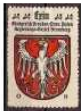
Fot 8: Herb Kcyni z albumu Kawy Hag 29

Także O. Hupp odpowiadał za rysunki na znaczkach reklamowych dołączanych do opakowań Kawy Hag. Znaczek poświęcony Kcyni zawiera herb w typowej dla Huppa stylistyce, z tą różnicą, że orzeł narysowany jest w manierze średniowiecznej, a więc bliższy wizerunkowi z najstarszej pieczęci.