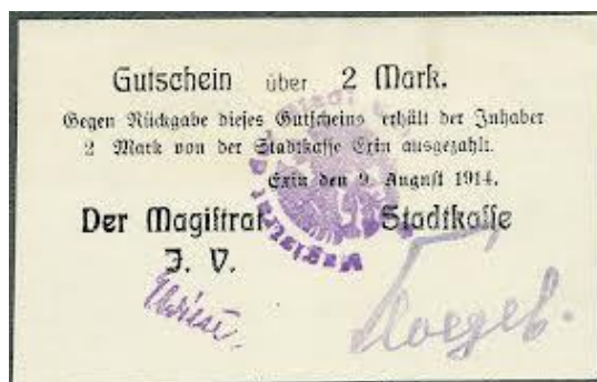
Fot 10: Różne przykłady kuponów i bonów miejskich Kcyni z lat I wojny światowej, z widocznymi odciskami pieczęci miejskiej z legendą niemiecką oraz pruskim godłem 31

W Kcyni, w ostatnich latach I wojny, w obiegu były także banknoty zastępcze, tzw. notgeldy . Nominaty to m.in. 10, 25 i 50 pfenigów oraz 1, 2 i 5 marek. Banknoty te na odwrotnej stronie miały widoczek miasta oraz herb według kompozycji Vossberga.