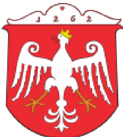
Fot 17: Herb Kcyni używany w latach 90, wyraźnie skopiowany z Vossberga 38