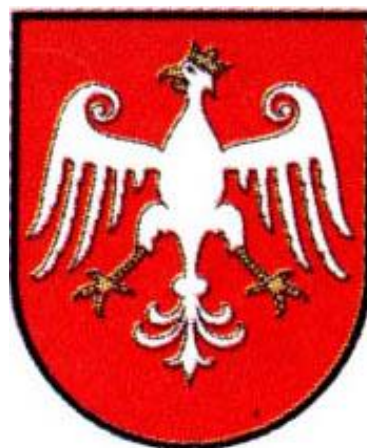
Fot 18: Herb Kcyni według Leksykonu miast polskich 39

U progu XXI wieku, mając świadomość uchybień w używanej symbolice, władze miasta postanowiły opracować nowy wzór herbu, a także flagę. Zadanie postanowiono wykonać własnymi siłami i środkami. Niestety, również w tym wypadku, opracowany wzór nie sięgał głębiej w tradycję heraldyczną Kcyni, a jedynie był próbą przetworzenia już używanego wizerunku na styl przypominający styl Haisiga. Mimo to, herb ten uzyskał pozytywną opinię tzw. Punktu Konsultacyjnego przy MSWiA dnia 15 lutego 2000. Odmienne na ten temat wypowiedziała się nowo powołana Komisja Heraldyczna. W opinii z 20 czerwca 2000 zwrócono uwagę, że proponowany orzeł ma górną linię skrzydeł wyciętą w sposób irracjonalny i obcy dla polskiej tradycji historycznej. Wytknięto również, że wizerunek jest kompilacją elementów różnych orłów autorstwa Mariana Haisiga. Błędna zdaniem Komisji była także zróżnicowana grubość linii konturowej tarczy 40 . Mimo tego, w związku z niejasną wykładnią niektórych przepisów dotyczących Komisji Heraldycznej, wizerunek herbu Kcyni przyjęto w 2001 roku, a następnie powielano w kolejnych statutach, ostatnio w roku 2008 41 . Komisja Heraldyczna podtrzymuje swoją opinię w sprawie herbu, czego wyrazem była negatywna opinia w sprawie projektów łańcuchów władzy, powodowana głównie użyciem błędnego wzoru herbu 42 .